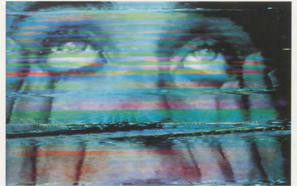
PIPILOTTI RIST, (ABSOLUTIONS) PIPILOTTI'S MISTAKES, 1988, stills of video tape (12 min.).

1) Nach der Übersetzung von Peter Laneus, erschienen im Diogenes Verlag, Zürich 1966, Kapitel 10, «Der Mann des Meeres». 2) «Get Lost» wurde von Anneli Fuchs und Lars Gramberg organisiert, beides Kuratoren des Louisiana Museums; «NowHere» fand vom 15. Mai bis 8. September 1996 im Louisiana Museum of Modern Art in Humlebaek statt. Im Museum of Contemporary Art in Chicago wurde ebenfalls eine Version von SIP MY OCEAN gezeigt (2. 7. bis 25.8.1996); vgl. dazu den aufschlussreichen Essay von Dominic Molon im Katalog zur Ausstellung. Beide Museen haben SIP MY OCEAN in ihre Sammlung aufgenommen. 3) Der Fluss stand in Flammen und nur du konntest mir helfen Seltsam, wozu die Sehnsucht leichtsinnige Menschen treibt Nie hätte ich mir träumen lassen, jemanden wie dich zu finden Nie hätte ich mir träumen lassen, jemanden wie dich zu verlieren Ach, ich will mich nicht verlieben... in dich. Chris Isaaks Wicked Game ist 1989 bei Warner Chappell Ltd. erschienen.