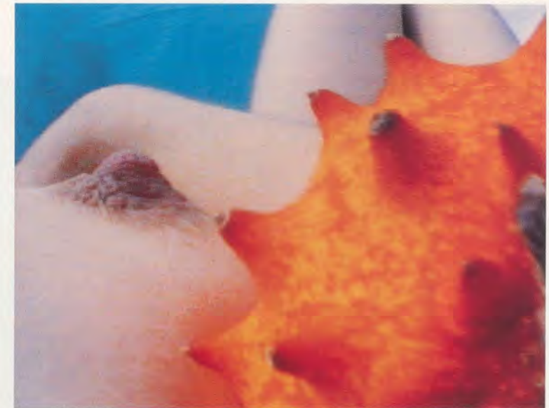
PIPILOTTI RIST, PICKELPORNO , 1992, Videotape (12 Min.) / PIMPLE PORNO .

The River was on fire and no one could save me but you Strange what desire will make foolish people do I never dreamed that I'd meet somebody like you I never dreamed that I'd lose someone like you Oh, I don't want to fall in love... with you. 3)