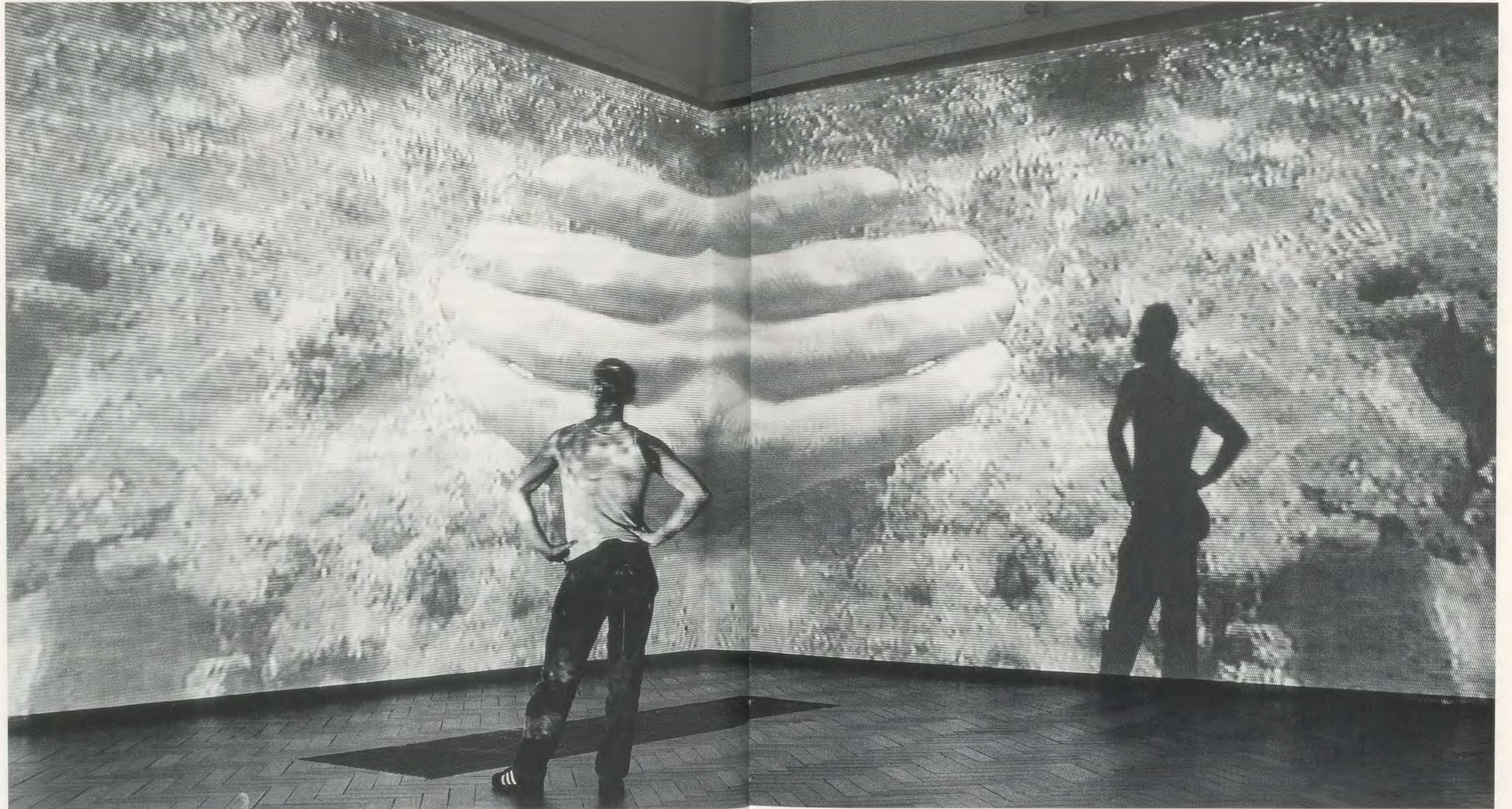
PIPILOTTI RIST, GROSSMUT BEGATTE MICH & SEARCH WOLKEN (Vorstufe von SIP MY OCEAN), 1995, Videoinstallation mit 3 Projektionen, 2 Playern, Audiosystem und 2 Videobändern.