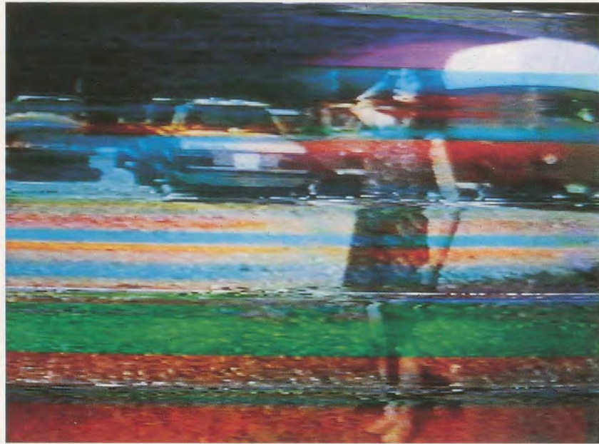
PIPILOTTI RIST, (ENTLASTUNGEN) PIPILOTTIS FEHLER, 1988, Stills aus Videoband (12 Min.).

Varianten. Die überwältigende Sinnlichkeit von SIP MY OCEAN mit seiner mehrfachen Projektion und den halluzinogenen Spiegelungen erinnert an die Abgehobenheit im Sinnenrausch: an unverfälschte, grenzenlose, präödiipale Freuden. Zu dieser Bilderwelt, die unwillkürlich mit dem Weiblichen in Verbindung gebracht wird, gehört die Vorstellung eines grenzenlosen Körpers mit zahlreichen, voneinander unabhängigen erotischen Zonen, kurz ein Körper im Vollbesitz seines Begehrens. Allerdings stört Rists unberechenbarer Gesang, in seiner ganzen Bandbreite von sanft lyrisch bis zu besessen schreiend, diese utopischen Träume ungetrübten Genus-