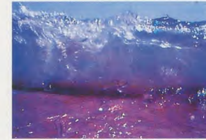
PIPILOTTI RIST, GROSSMUT BEGATTE MICH, 1994, & SIP MY OCEAN, 1996. Videostills aus den Installationsbändern / video stills of installation tapes.