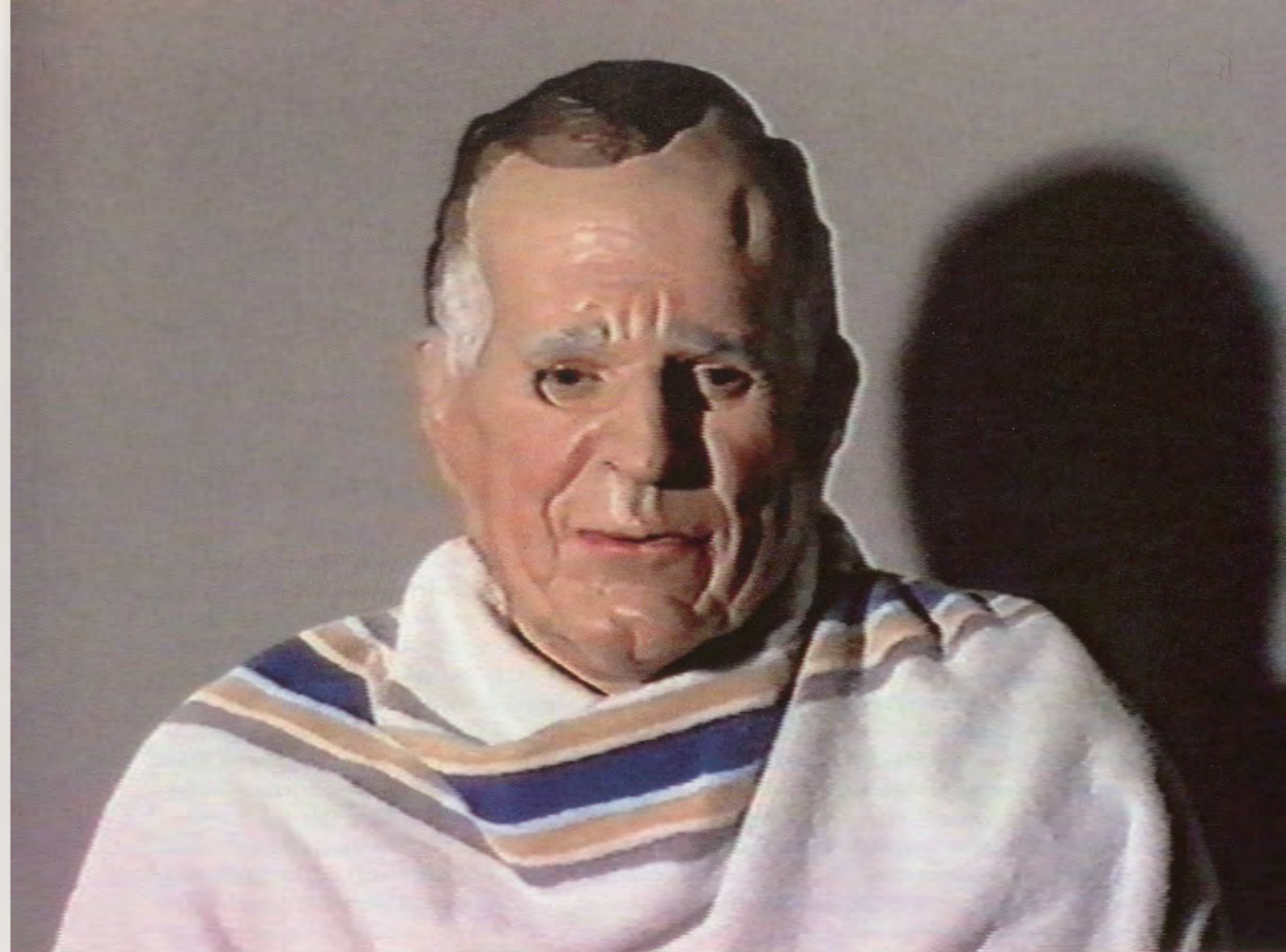
GILLIAN WEARING, CONFESS ALL ON VIDEO, DON'T WORRY YOU WILL BE IN DISGUISE. INTRIGUED? CALL GILLIAN... , 1994, still from 30-min. DVD for monitor / BEICHTEN SIE ALLES AUF VIDEO, KEINE ANGST, SIE WERDEN MASKIERT SEIN.

Obwohl Gillian Wearing's Kunst überaus vielseitig und einfallsreich ist, scheint es in ihren Arbeiten immer um diesen einen Gedanken zu gehen, dass es ebenso lehrreich wie zutiefst verstörend sein kann, in die Realität einer anderen Person zu schlüpfen. Unter vielerlei Gesichtspunkten und unter Einsatz verschiedenster Techniken wendet sich Wearing immer wieder demselben Themenkomplex zu und untersucht den fragilen Grenzbereich, wo die eigene Persönlichkeit endet und jene eines anderen beginnt. Seit SIGNS THAT SAY WHAT YOU WANT THEM TO SAY AND NOT SIGNS THAT SAY WHAT SOMEONE ELSE WANTS YOU TO SAY (Schilder, die das sagen, was man sagen will, und nicht Schilder, die sagen, was jemand anderer will, dass man sagt, 1992–93) – also jener Arbeit, mit der sie definitiv den Durchbruch schaffte – hat Wearing versucht, die verborgene Dynamik des Dokumentarischen zu unterlaufen: nämlich, dass die angebliche Objektivität der Form in Wirklichkeit dazu dient, das Thema subtil zu manipulieren, während der Autor sich fein säuberlich aus dem Bild heraus hält. Indem Wearing Passanten bittet ihren eigenen Text aufzuschreiben und diesen dann mit der Kamera aufzeichnet, stellt sie sicher, dass einem allfälligen Betrachter der Arbeit die hinter den Kulissen getroffenen Vereinbarungen implizit bewusst werden. Wearing führt uns nicht vor,