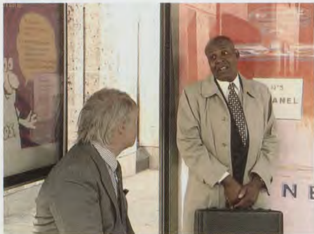
GILLIAN WEARING, 10–16, 2001, stills from 24-min.

DVD for back projection. Scene at busstop (top),