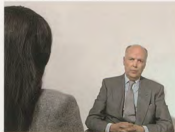
GILLIAN WEARING, 10–16, 2001, Szenen aus der 24-minütigen

DVD für Rückprojektion. An der Bushaltestelle (oben links),