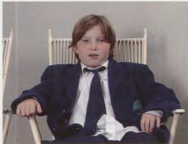
GILLIAN WEARING, 2 INTO 1 , 1997, 4 min. 30 sec. video with sound; video still of Lawrence speaking with Hilary's voice / 2 IN 1, 4 1/2-Minuten-Video mit Ton; Videostill von Lawrence, der mit Hilary's Stimme spricht.

then recorded with her camera, Wearing ensures that the eventual viewer of the piece becomes implicitly aware of the negotiations that took place behind the scenes. Wearing is not showing us what she found in the world and asking us to accept it as an objective fact; rather, she has enlisted others in the completion of a task, while making it clear that she is fully complicit in the outcome. If the results surprise us by revealing much more than one expects to see from photographs of strangers in a neutral setting, this is largely due to the degree to which the conventions of the photographic document have become so deeply rooted in our cultural experience. At first we think we are seeing something that falls safely within those conventions, only to discover that the rules have been emphatically turned upside down.