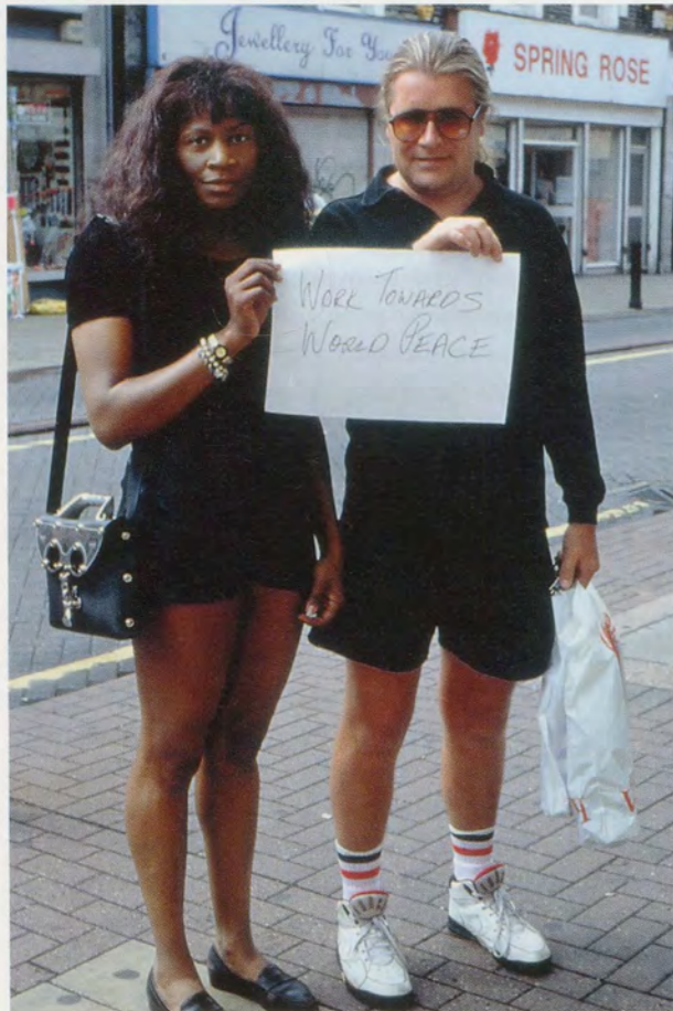
GILLIAN WEARING, SIGNS THAT SAY WHAT YOU WANT THEM TO SAY AND NOT SIGNS THAT SAY WHAT SOMEONE ELSE WANTS YOU TO SAY, 1992–1993, c-type prints mounted on aluminum, 15 3/4 x 11 13/16" / SCHILDER, DIE DAS SAGEN, WAS MAN SAGEN WILL, UND NICHT SCHILDER, DIE SAGEN, WAS JEMAND ANDERER WILL, DASS MAN SAGT, C-Prints auf Aluminium aufgezogen, 40 x 30 cm.