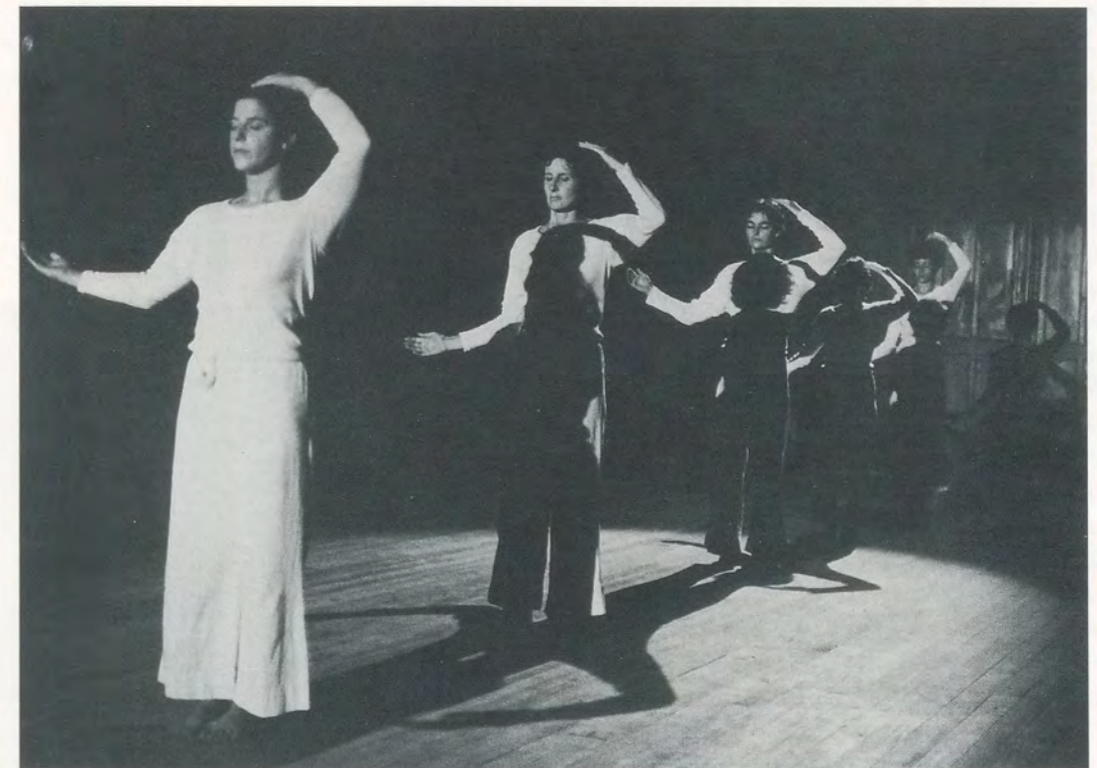
TRISHA BROWN COMPANY IN LINE UP/SCHLANGE STEHEN, 1976.