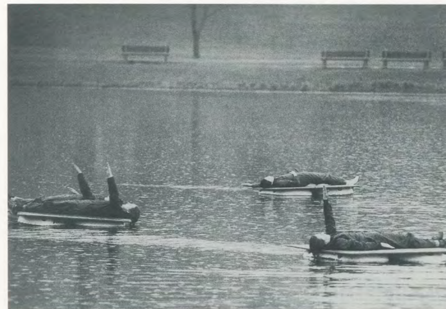
TRISHA BROWN COMPANY IN PRIMARY ACCUMULATION / ERSTE AKKUMULATION, 1972.