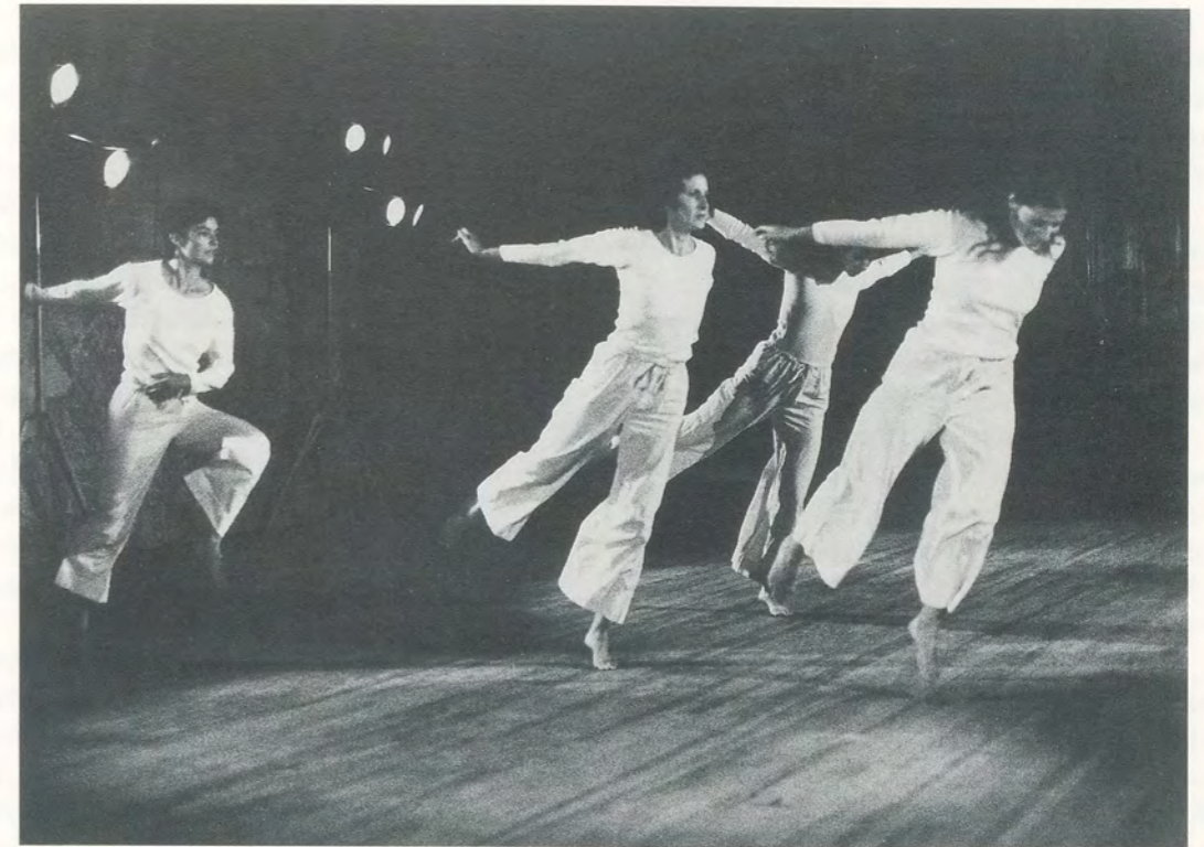
TRISHA BROWN COMPANY IN LINE UP/SCHLANGE STEHEN, 1976.