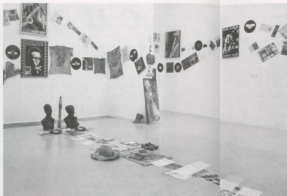
GEORGES ADÉAGBO, LA MORT ET LA RÉURRECTION, 1997, installation, Nathalie Obadia Gallery, Paris / DER TOD UND DIE AUFERSTEHUNG.

"The Biennale is an announcement that South Africa is opening itself up to the world." This noble sentiment, expressed at a press tour by Okwui Enwezor, the exhibition's head curator, laid bare the project's ambitions. By bringing the flow of global cultural goods through Johannesburg, South Africans would have the opportunity to plug into a larger dialogue, to declare their cosmopolitanism. Between the lines, however, this international welcome read as an urban redevelopment scheme for the world to witness. By holding the exhibition in a disused downtown power plant whose architectural twin incidentally contained a