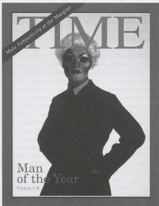
IKE UDE, MAN OF THE YEAR, 1997, from the "HE" series.