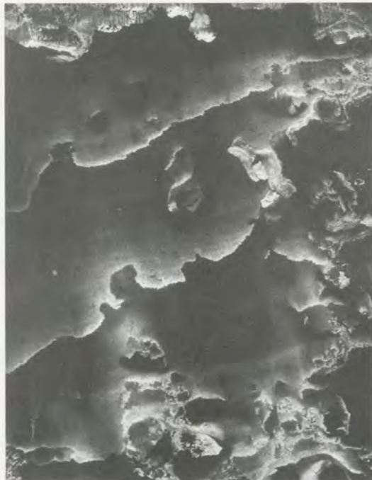
Décalcomanie by / von MARCEL JEAN. (from / aus: "Minotaure," No. 8, 1936)

Southwark, wechselt mit jeder Ausstellung das Thema und bezieht stets die Besucher ins Ausstellungsgeschehen ein. Im vergangenen Winter wurden in einer geistreichen, vielfältigen Schau zum Thema «The Unknown (Das Unbekannte)» ebenfalls Wahrnehmungsexperimente und esoterisch-unheimliche Künste miteinander verknüpft. 4) Im «Saal der Fragen» im Erdgeschoss waren Orakel aller Art aufgebaut. Der Besucher war aufgefordert, das Glücksrad zu drehen («Das Rad befürchtet das Schlimmste für Sie. Bleiben Sie zu Hause.»), wobei ihm in einer Reihe von Zigeunerwagen uralte Verfahren der Weissagung neben moderneren Methoden, Weisheit zu erlangen, angeboten wurden. Man konnte nach Belieben die Bibel oder das Fernsehen für Vorhersagen heranziehen und konnte sich im Salz-, Wachs-, Nabel- oder Feigenblattlesen versuchen. Im Obergeschoss waren in