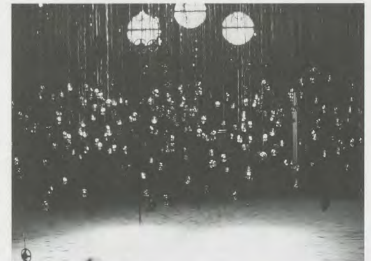
SUSAN HILLER, WITNESS, 2000, installation view / ZEUGE. (COMMISSIONED BY ARTANGEL, MAY 2000 / PHOTO: ARISA TAGHIZADEH)

Victor Hugo verwendete absichtlich Verschüttetes und Gefaltetes als Ausgangspunkt für einige seiner grossartigen Tusch- und Aquarellvisionen von Abgründen, Ungeheuern und Fata Morganas.