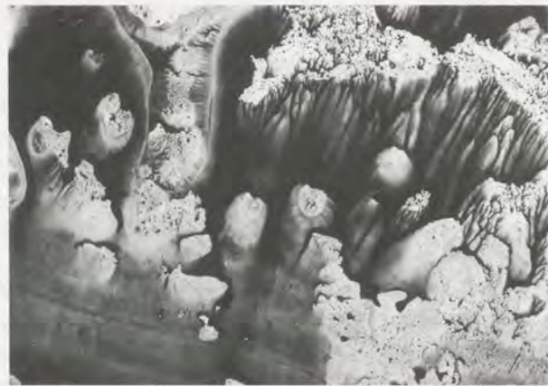
Décalcomanie by / von OSCAR DOMINGUEZ (from/ aus: "Minotaure," No. 8, 1936)

visitations in a television set, and, with WITNESS (1999), a recent installation of dangling microphones relaying spirit sightings, visions of angels and UFOs and other phenomena, she staged an atmospheric, eerie vindication of the material's intrinsically puzzling character. The comfortable snigger of the skeptical mind was no longer any kind of appropriate response to WITNESS . The piece left the visitor stranded among mysteries that raise fundamental questions about the status of experience and human sense perception: the very word reality begins to demand inverted commas, or, as in the Lacanian usage of Slavoj Žižek, the