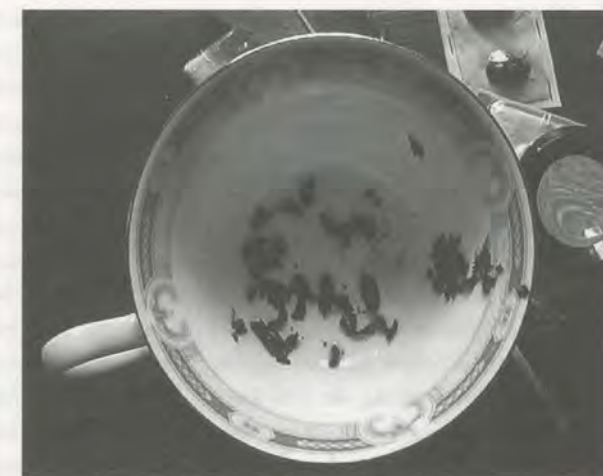
JAKI IRVINE, IVANA'S ANSWERS, 2001, video still / IVANA'S ANSWERS.

every kind speaking in human languages, and see "destructions in the sky"—"O marvel of mankind!" he exclaimed at this capacity. "You will speak with animals of every species and they with you in human speech." In that other, more famous passage in the Notebooks , he recommends, as an "aid to reflection," that the artist meditate on "walls splashed with a number of stains or stones of various mixed colors. ...You can see various battles, and rapid action of figures, strange expressions on faces, costumes, and an infinite number of things, which you can reduce to good, integrated form." He continues, offering other sources of inspiration, all of them indeterminate, elusive: the ashes of a fire, or mud, or clouds—the list drifts through "like things," formless, and, he writes later, "confuse," inscrutable in themselves for they are intrinsically meaningless. 1) They will however offer the subjective fantasy "una nuova invenzione di speculazione" by which "if you consider them well, you will find really marvelous ideas." Fantasia for Leonardo was embedded in the thinking ventricle of the brain, between sensus communis and intellectus : he integrated it far