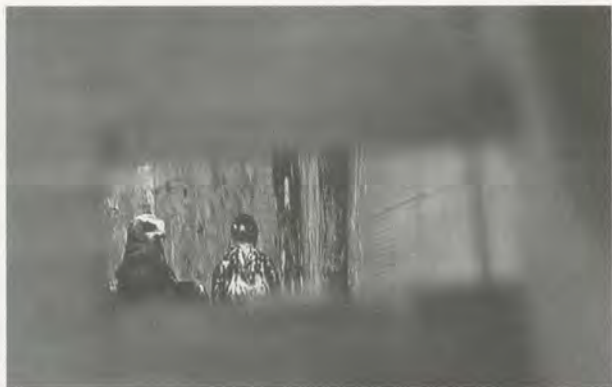
JAKI IRVINE, IVANA'S ANSWERS, 2001, video still / IVANAS ANTWORTEN.

Real becomes not only "Real," but means the very opposite of its normal usage. The symbolic haunts the absence of meaning and invests the fantastic with a new reality. Hiller's chorus of testimonies to weird and wonderful happenings and visions reported this "Reality" in her witnesses' minds, and accorded it the seriousness and value of data obtained through what's thought of as objective means—the media of modern communications. Nothing can be trusted, or everything can be.